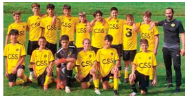
Aus eins mach zwei: Die CSS ist neu auch auf den Auswärtsshirts (blau) der Junioren C sichtbar.