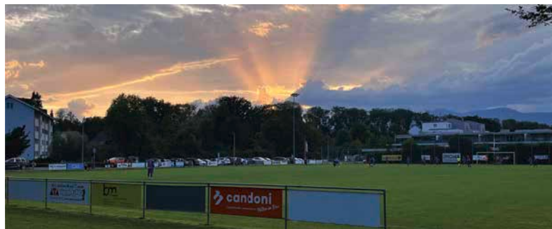
WA-Cup 2024 – «Das isch der Kirchacker – Das isch üses Dehei»

Wir freuen uns dich/euch an einem dieser Events oder einfach auf dem Sportplatz Kirchacker zu treffen. Hopp FC Gerlafingä!